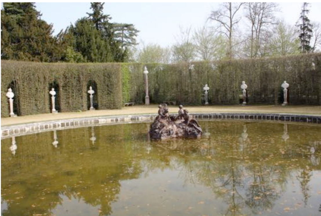
Fig. 2., Amphithéâtre du jardin des Marronniers du musée national des châteaux de Versailles et de Trianon

temps de l'empire romain car il diffusait le portrait de l'empereur parmi la population, le buste va progressivement changer de fonction. Quittant son rôle premier, autrement dit celui d'objet de sacralisation, il devient progressivement un objet d'ornement. À ce titre, il est placé dans les couloirs et même dans les espaces extérieurs des résidences, afin d'être admiré. Sa disposition est réfléchie. Etablir un rapport étroit entre espace végétal et sculptures dans les jardins est salué. Jean de la Fontaine, écrit à propos des jardins des châteaux de Versailles et de Trianon : « Tant de beaux jardins et de somptueux édifices sont la gloire de leur pays. Et que ne disent point les étrangers ! Que ne dira point la postérité quand elle verra ces chefs-d'œuvre de tous les arts » 1 . Le raffinement passe par la culture et surtout celle de l'Antiquité.