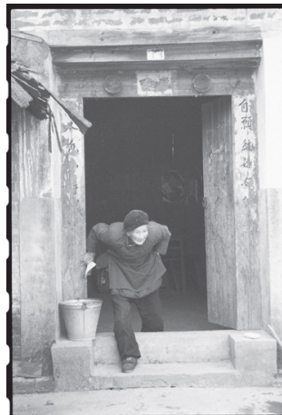
Fig. 7 : Yang Huanyi sortant de la maison avec un livret dans la main droite, village de Yangjia, canton de Shangjiangxu 1998

Lo visita trois fois la région de l'écriture des femmes entre 1998 et 2003. Ce fut l'occasion de passer son temps avec les femmes du lieu et en particulier avec les survivantes âgées désireuses de partager avec elle leurs souvenirs des jours où l'écriture comme le chant des femmes étaient pratiqués. Elle les photographia, tenant souvent quelque échantillon d'écriture des femmes et enregistra leurs mélodies nūge. Sa photo de Yang Huanyi sortant de la maison avec un fascicule de nūshu dans la main droite fait partie d'une série de photos et de vidéos, témoignages sur les femmes du pays pratiquant tant l'écriture que les chants des femmes.