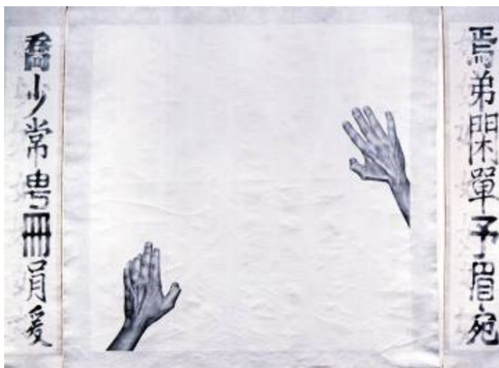
Fig. 1 : Mapping [Configuration] de Lo Yuen-yi, graphite sur toile encollée, 183 × 244 cm, 1998.