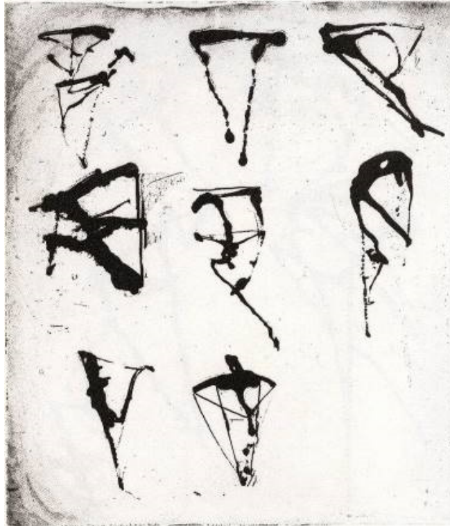
Fig. 2 : Brice Marden, Etchings to Rexroth , 1986, gravure 2. Courtesy of the artist