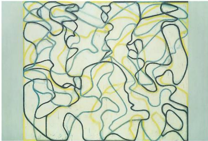
Fig. 4 : Brice Marden, Second Letter (Zen Spring) , 2006-2009. Oil on linen, 244 x 366 cm. Matthew Marks Gallery, New York. Courtesy of the artist.