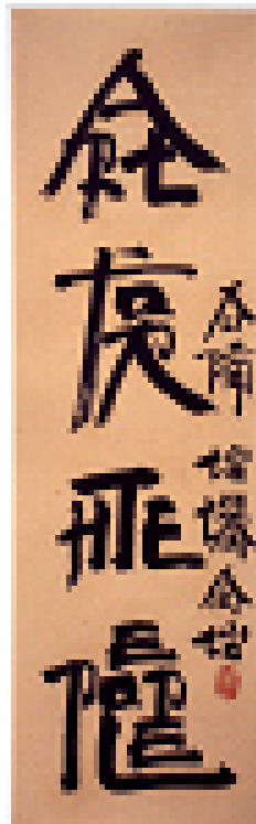
Fig. 4 : Xu Bing, New English Calligraphy - Art for the People

woodblock hand printed book and ink rubbing with wood cover, Courtesy of Xu Bing Studio.