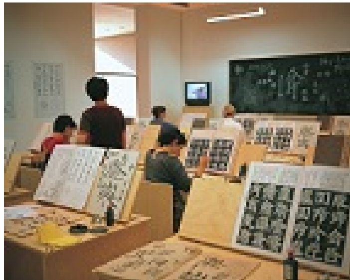
Fig. 2 : Xu Bing, Square Word Calligraphy Classroom , 1994-6

Installation of hand-printed books and ceiling and wall scrolls printed from wood letterpress type, ink on paper, each book, 18 1/8 × 20 in., three ceiling scrolls, each 38 in. × 114 ft. 9 7/8 in., each wall scroll 9 ft. 2 1/4 in. × 39 3/8 in.