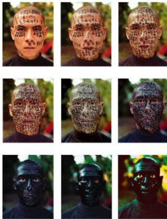
Fig. 6 : Zhang Huan, Family Tree , 2000, New York, USA

Ink on paper, Courtesy of Xu Bing Studio.