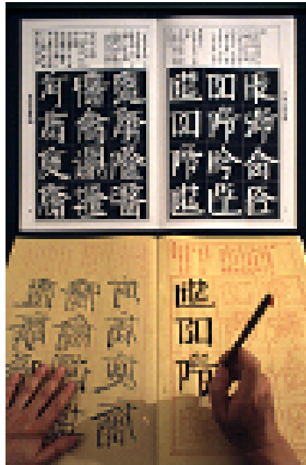
Fig . 3 : Xu Bing, Text pages from An Introduction to Square Word Calligraphy , 1994-6

woodblock hand printed book and ink rubbing with wood cover, Courtesy of Xu Bing Studio.