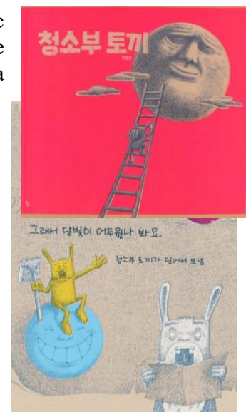
fig. 7 Le Lapin nettoyeur , Han Ho-jin, © Bandal

Une légende coréenne rapporte que des lapins vivent sur la lune et qu'ils y fabriquent des gâteaux de riz ou des médicaments à l'aide d'un pilon et d'un mortier. Aussi existe-t-il un lien récurrent entre la lune et les lapins dans la littérature enfantine, et certains titres s'appliquent à expliquer la présence des lapins sur la lune, ou bien celle du mortier et du pilon. Ne prenons que deux exemples : Le Lapin nettoyeur de Han Ho-jin (2015) et J'aime la lune de Na Myong-nam (2016) 18 . Dans le premier, les lapins s'inquiètent de voir la belle lune bleue souriante qu'ils connaissent froncer les sourcils, virer au rose sombre et souffler de la fumée (fig. 7). Le nettoyeur décide de s'y rendre. La lune se porte bien. C'est la Terre qui est souillée. D'où l'aspect bilieux de l'astre inquiet. Alors les lapins gagnent la lune bleue et propre, que l'on continue de voir rose et soucieuse depuis la Terre. Le monde va certes mal mais ce n'est pas pour autant que les ténèbres sont de retour. Le rose du ciel que l'on voit en couverture et qui baigne les