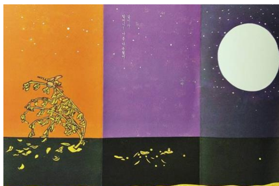
fig. 2. Semis de haricots , Sin Bo-leum, © Bandal

Commençons par le dernier. Au verso, ce leporello explique comment planter les haricots, et au verso, il montre en huit séquences la croissance de la plante. Elle commence à pousser au matin, résiste aux intempéries de la journée, se développe, fleurit et donne ses gousses à la nuit tombée. Sa croissance est resserrée sur une journée, et tout s'achève dans une nuit sombre et ardoise, percée d'une énorme lune blanche entourée d'étoiles (fig. 2). Le cycle est bouclé, la nuit revient, elle n'est plus un immuable chaos, mais l'élément-clé d'une révolution rôdée, le symbole d'un achèvement. Il ne faut pourtant pas se fier au calme puissant qui émane d'elle. Il est des nuits moins sages qu'elles n'y paraissent.