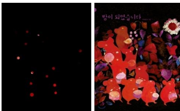
fig. 3-4. La nuit est arrivée , Ju Li-byeeol

En témoinne La nuit est arrivée . En confirmation du titre, une jaquette noire recouvre le livre (fig. 3-4). Percée de trous, elle s'égaie de points de couleurs chaudes. L'image de couverture est en fait des plus vives. On y surprend des souris au plus fort d'une fête.