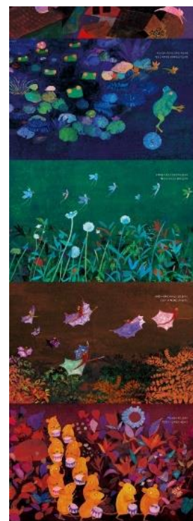
fig. 5. La nuit est arrivée , Ju Li-byeeol, © Bandal

C'est la mise en place de cette fête que cet album nous rapporte. Il s'ouvre sur une double page d'un profond bleu ardoise juste entamé par une phrase annonçant que la nuit est venue. À la deuxième double page, ce bleu est percé de petits éclats de lumière qui se révéleront être des pupilles de chats. Tout un bestiaire se met alors en mouvement : grenouilles, insectes, chauve-souris, souris... Tous convergent vers un arbre enluminé de lucioles. Le temps de cette convergence, la nuit reste sombre mais passe du bleu à l'indigo, au vert sapin, puce, lie-de-vin... La nuit n'a que faire du noir, elle dispose d'une palette rarement exploitée (fig. 5). Sur la double finale, s'approfondissant davantage, elle retrouve son ton ardoise, mais elle est mouchetée et l'on devine que la fête continue un peu plus bas ou un peu plus loin. Elle témoigne ainsi de toute la vie animant le monde nocturne qui ne devrait, quoi qu'il arrive, jamais replonger dans le noir complet. Sauf incident.