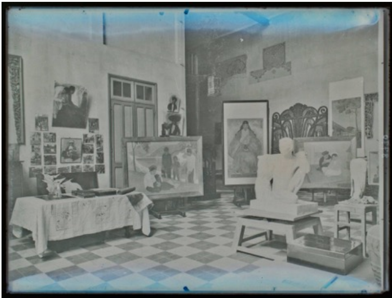
Figure 2 : Anonyme, sans titre (groupe d'œuvres), c. 1930. Photographie, collection privée. Droit d'auteur : Pham Hai.

Cette photographie nous permet de considérer l'encadrement de l'œuvre. La peinture apparaît circonscrite par des bandes de soie brochée à la façon d'un rouleau suspendu. Nous pouvons d'ailleurs remarquer, accrochée au mur sur la droite, une autre peinture montée en rouleau suspendu. Pourtant, notre tableau jouit d'un second encadrement cette fois composé de baguettes de bois suivant l'usage occidental, un encadrement qui contredit le premier. Cette redondance du cadre est apte à séduire les collectionneurs français qui y trouvent à la fois le goût de l'ailleurs véhiculé par le rouleau suspendu déjà connu de l'Europe par les kakemonos japonais rencontrés lors du courant japoniste du siècle dernier, ainsi que la familiarité d'accrochage et d'usage du cadre à l'européenne. L'artiste propose une synthèse pertinente et opportune de deux traditions qui, en outre, permet à son œuvre d'accrocher le regard de façon incomparable. Bien que le montage en rouleau suspendu soit aussi pratiqué au Viêt Nam, ce n'est cependant pas une technique que les amateurs associent immédiatement aux arts de l'ancienne Indochine.