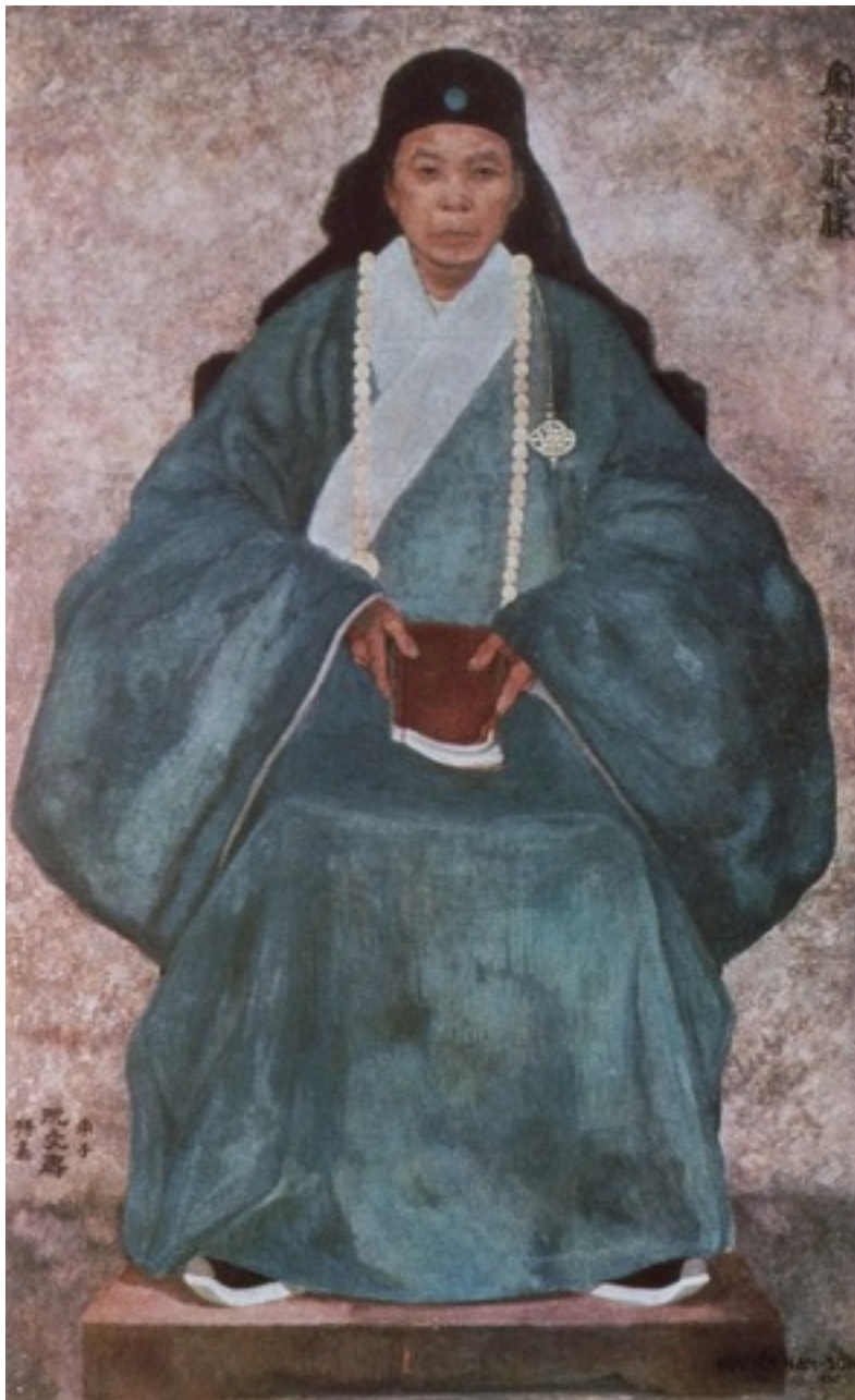
Figure 1 : Nam Sơn (1890-1973), Portrait de ma mère, 1930. Huile sur toile, 95cm, collection privée.