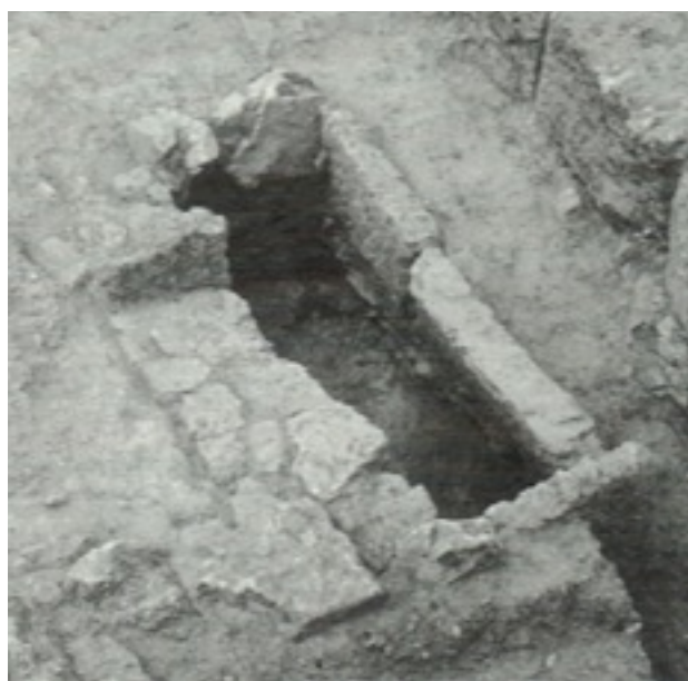
Figure 6.2 : Fosse A vidée [Retouche Manon Sauvage, d'après Bookidis and Stroud 1997, Corinth XVIII.3 - Plate 26b (Pit A after excavation [from NE])]

Contemporaine de la fosse A et située à quelques mètres à l'ouest de celle-ci se trouve la fosse E ( fig. 2 ). Outre leur proximité topographique, ces deux cavités sont également de constitution très semblable. On retrouve une dalle de pôros consolidant la paroi est ainsi que des blocs de calcaire au sud, le côté ouest n'était quant à lui pas architecturé tandis que le mur de petits moellons au nord appartenait à une construction antérieure ( fig. 7.2 ) 12 . De plus, quatre grands fragments de tuiles venaient fermer cette construction ( fig. 7.1 ) qui possède des dimensions similaires à la précédente : sa superficie est d'environ 1,75 m 2 pour une profondeur de 0,54 m. Le contenu est également semblable à celui de la