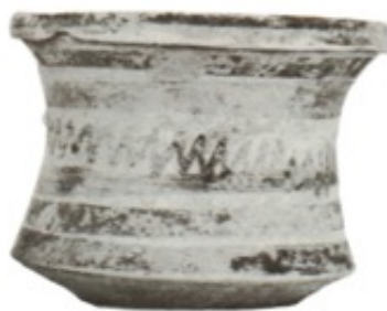
Figure 4.2 : Exemple de kalathiskos (provient de la fosse E) [Retouche Manon Sauvage, d'après Pemberton 1989, Corinth XVIII.1 - Plate 8.58, (C-65-585), photographie : Ino Ioannidou and Lenio Bartzioti. American School of Classical Studies at Athens, Corinth Excavations.]