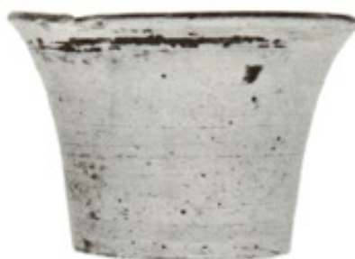
Figure 4.1 : Exemple de kalathiskos (provient de la fosse 1970-1) [Retouche Manon Sauvage, d'après Pemberton 1989, Corinth XVIII.1 - Plate 4.12 (C-70-501) , avec l'aimable autorisation de l' American School of Classical Studies at Athens, Corinth Excavations. ]

Le lot de vases issu de la fosse 1970-1 ( fig. 3 ) est composé majoritairement de kalathiskoi 9 (39) ( fig. 4.1 et 4.2 ) et de quelques cotyles et œnochoés ( fig. 5 ), sur un total de 49 vases dont 31 étaient intacts, 12 brisés mais complets, et les 6 derniers incomplets. Les vases étaient posés au fond, emboîtés les uns dans les autres et recouverts de terre. Aucun autre objet n'ayant été mis au jour dans cette fissure, sa datation vers la fin du VII e siècle se fonde uniquement sur l'analyse typologique des vases qu'elle renfermait. La fosse 1970-2 est située à 1,50 m au sud-est de la précédente. Son contenu est moins conséquent puisqu'il n'est composé que de 8 vases de 4 formes différentes ( kalathiskos , dinos , tasse apode, plat à pied et poignées). Le plat est le seul élément qui n'a pas été découvert intact même s'il était complet. La datation des vases s'étale entre le dernier quart du VII e et le deuxième quart du VI e siècle 10 .