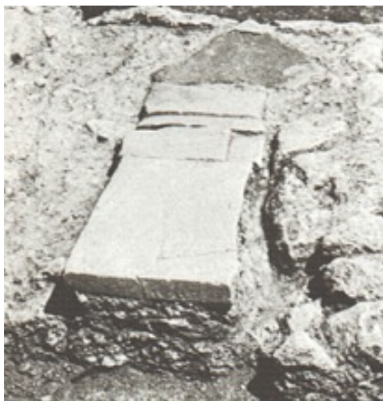
Figure 7.1 : Fosse E avant la fouille [Retouche Manon Sauvage, d'après Pemberton 1989, Corinth XVIII.1 - Plate 2a (group 4, pit covered)]

fosse A : tout d'abord un niveau de terre compacte mélangée à de grandes quantités de vases brisés puis un niveau de vases entiers disposés de façon particulière. Dans le cas de la fosse E, ce dernier niveau ne comporte pas seulement des kalathiskoi – bien que cette forme soit encore présente en grande majorité avec 11 individus –, mais aussi deux krateriskoi 13 , un bol miniature, un lécythe corinthien ainsi qu'une œnochoé à figure noire. Ces objets étaient posés soit sur leur côté, soit debout, l'un d'entre eux était même installé lèvre au sol. Le remplissage ne comportait cependant qu'une seule figurine fragmentaire ainsi que quelques débris dont une amulette de scarabée en cornaline. Aucun élément ne semble appartenir à une période antérieure à la 2 nd e moitié du V e siècle. Il convient de noter que cette cavité se situe le long du mur nord de l'« oikos » 14 .