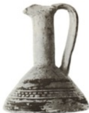
Figure 5 : Exemple d'aenochoe (provient de la fosse 1970-1) [Retouche Manon Sauvage, d'après Pemberton 1989, Corinth XVIII.1 - Plate 4.1 (group 1, C-1970-479), avec l'aimable autorisation de l'American School of Classical Studies at Athens, Corinth Excavations.]

Le second type de fosses connaît des variantes, tant en ce qui concerne la superficie que la maçonnerie ; elles ont toutefois en commun une forme grossièrement rectangulaire. La fosse A ( fig. 2 ) a été creusée jusqu'au rocher de la Terrasse Médiane sur une profondeur de 0,65 m et sur une superficie totale de 1,44 m 2 . Les parois ont été consolidées avec des dalles de pôros sur les côtés nord et ouest et des moellons de calcaire au sud ( fig. 6.2 ) ; en outre, cette cavité a été recouverte par deux niveaux de fragments de tuiles ( fig. 6.1 ) en terre cuite posées à plat. Le remplissage était composé de terre très compacte mêlée à des fragments de vases (93 individus ont pu être recensés, dont 3 intacts, comprenant aussi bien des formes miniatures que des éléments de vaisselle) et à 12 figurines très fragmentaires, dont 9 étaient suffisamment bien conservées pour être inventoriées : des figures masculines et féminines, tant assises que debout, sans attribut distinctif ainsi qu'un oiseau. Par ailleurs, sur le fond de la fosse ont été découverts 7 kalathiskoi entiers posés sur leur pied, de manière très certainement intentionnelle. L'étude de ces objets permet une datation à partir de la fin du VI e siècle, bien que la majorité des éléments appartienne au dernier quart du V e siècle. Il est important de signaler que ce creusement se trouve le long du mur ouest de la Pièce E ( Q: 26, fig. 2 ) dont la fonction n'a pas pu être identifiée 11 .