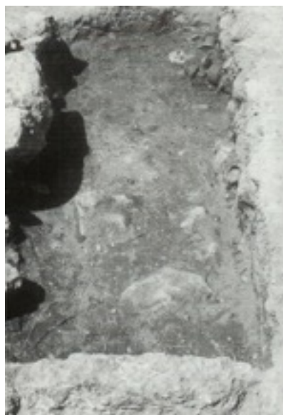
Figure 7.2 : Fosse E vidée [Retouche Manon Sauvage, d'après Bookidis and Stroud 1997, Corinth XVIII.3 - Plate 26d (Pit E after excavation, deposit in western end [from E]), avec l'aimable autorisation de l'American School of Classical Studies at Athens, Corinth Excavations. ]