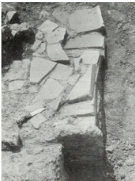
Figure 6.1 : Fosse A avant la fouille [Retouche Manon Sauvage, d'après Bookidis and Stroud 1997, Corinth XVIII.3 - Plate 26a (Pit A before excavation [from N]), photographie : R. Stroud. American School of Classical Studies at Athens, Corinth Excavations.]