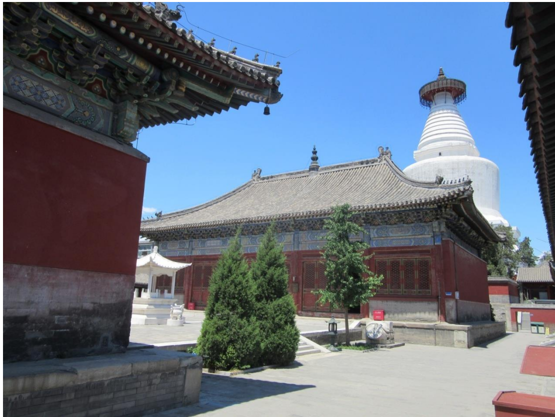
Figure 3 : le Temple Miaoying si 妙應寺 et sa pagode (photo de l'auteur).

C'est aussi à cette époque que Pékin, en tant que centre des activités religieuses, connut ses premiers édifices de styles étrangers. On doit les deux plus grandes pagodes tibétaines (pagode de forme « bol renversé » d'après le terme architectural chinois) en Chine — dont l'une se trouve dans le temple Miaoying si 妙應寺 de Pékin — à Araniko, un architecte népalais qui travaillait auprès de Kubilai Khan ; et les deux pagodes de forme stûpa (une terrasse surmontée de cinq pagodes) que l'on trouve dans la banlieue ouest de Pékin sont attribuées à un moine indien qui inspira l'empereur Yongle des Ming par une image du Temple de la Mahabodhi. Sous les Qing, l'empereur Qianlong reproduisit directement les temples réputés du Tibet dans ses jardins impériaux, forgeant ainsi un style spécial qui marqua l'architecture bouddhique officielle de son époque. Son objectif, comme il l'exprime explicitement, était avant tout de renforcer le lien entre les peuples de l'empire. Sur le sommet de la colline principale de son jardin Qingyi yuan 清漪園, aujourd'hui connu comme le Palais d'été, ce monarque a fait construire deux gigantesques temples, l'un donnant sur le sud, dans le style chinois, et l'autre sur le nord, dans le style tibétain. Ce n'est pas simplement un aménagement architectural, mais aussi un grand dessin de la vision religieuse de l'empire, un modèle du cosmos en miniature, qui met la ville de Pékin sur la place d'un nœud reliant le nord et le sud.