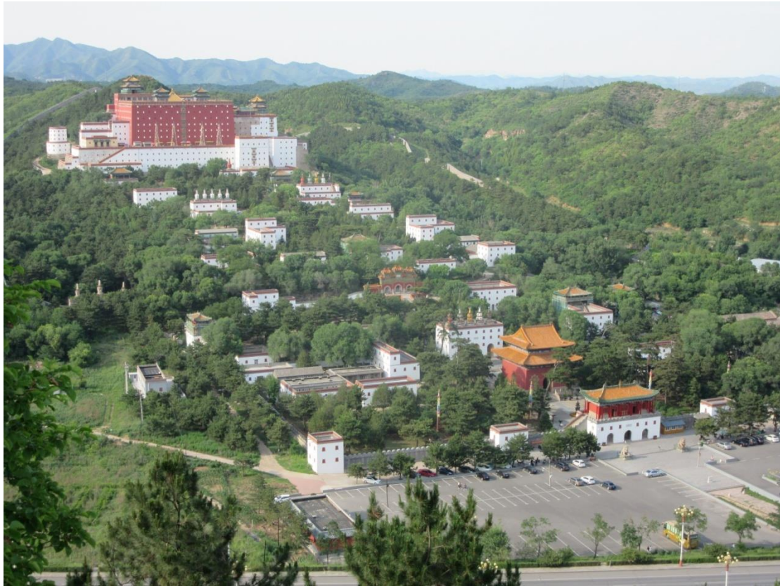
Figure 4 : le Temple Putuozongcheng zhi miao établi par l'empereur Qianlong à Chengde.

Élément fondamental de la scène religieuse pékinoise depuis sept siècles, le bouddhisme vajrayāna frappe par son influence sur la vie politique de l'État, par son origine étrangère et aussi, d'un point de vue esthétique, par ses œuvres iconographiques et statuariques qui représentent un autre aspect des divinités. Gabriel de Magaillan, jésuite portugais qui travailla à la cour de l'empereur Kangxi, fut évidemment frappé par l'étrangeté du temple Yongning si dans la ville impériale de Pékin : « l'idole est sur l'autel dans le temple, en forme d'un homme tout nu et vilain comme le dieu Priape des Romains [...] Le feu roi père de l'empereur régnant fit bâtir ces deux temples par raison d'État [...] et pour faire plaisir à sa mère, fille d'un petit roi des Tartares Occidentaux, parce que cette princesse est fort affectionnée aux lama, et les entretient à Pe kim avec de grandes dépenses. Mais il y a apparence qu'aussitôt qu'elle sera morte on fermera ces temples abominables » ( Nouvelle relation de la Chine ).