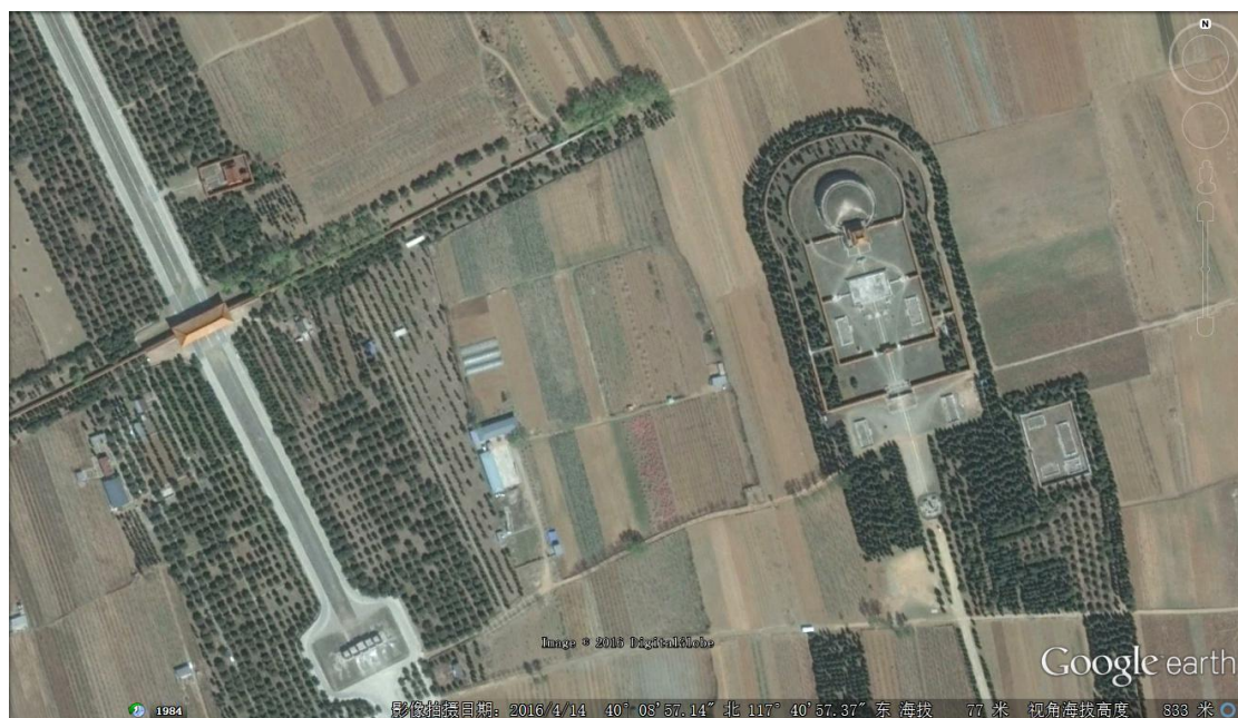
Figure 1 : Le tombeau de l'impératrice douairière Xiaozhuang 孝莊 à l'extérieur de l'enceinte du terrain des tombeaux impériaux à Zunhua 遵化.

La Chine se présente comme une civilisation de murs aux yeux des Occidentaux. « Mesquin », c'est le mot employé par Julien de Rochechouart, ambassadeur de France à Pékin de 1866 à 1872. Néanmoins, ce qui mérite notre attention n'est pas la façon dont les Barbares ont brisé militairement les murs des Chinois, mais leur habileté, dès qu'ils entrent en Chine, à jouer avec la notion rituelle chinoise du mur. Un exemple typique date du début des Qing. En 1644, l'empereur Shunzhi installa son peuple dans la ville intérieure de Pékin et les habitants chinois furent obligés de se déplacer dans la ville extérieure — ces deux parties de la capitale séparées par un mur obtiennent ainsi respectivement leur surnom de villes « tartare » et « chinoise ». Quatre décennies plus tard, la mère de l'empereur Shunzhi, alors impératrice douairière de Kangxi, à la fin de sa vie, a dû faire face à la question de l'emplacement de son tombeau. À cette époque, un terrain réservé aux tombeaux impériaux avait déjà