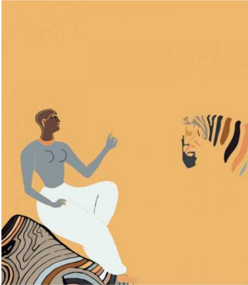
Welcome to the desert