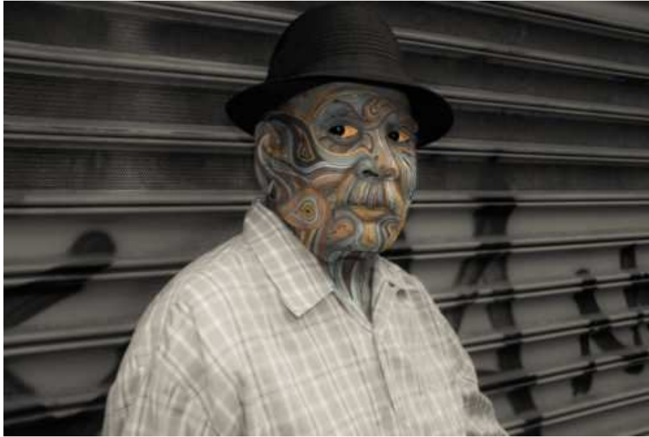
He Puts His Mask