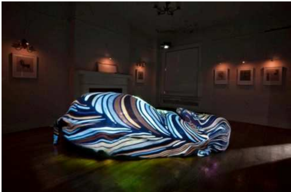
The Animal Is