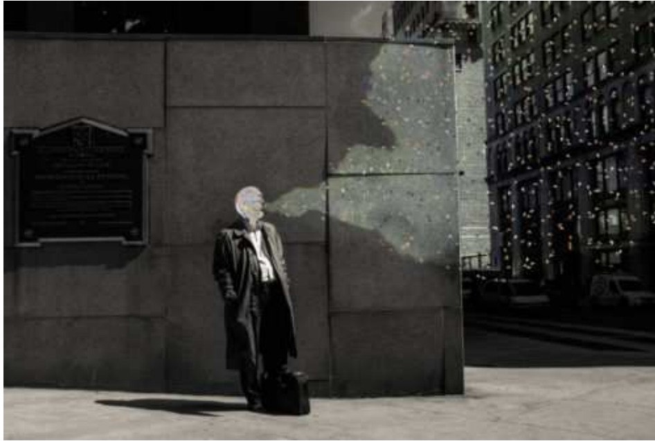
He Waits on Park