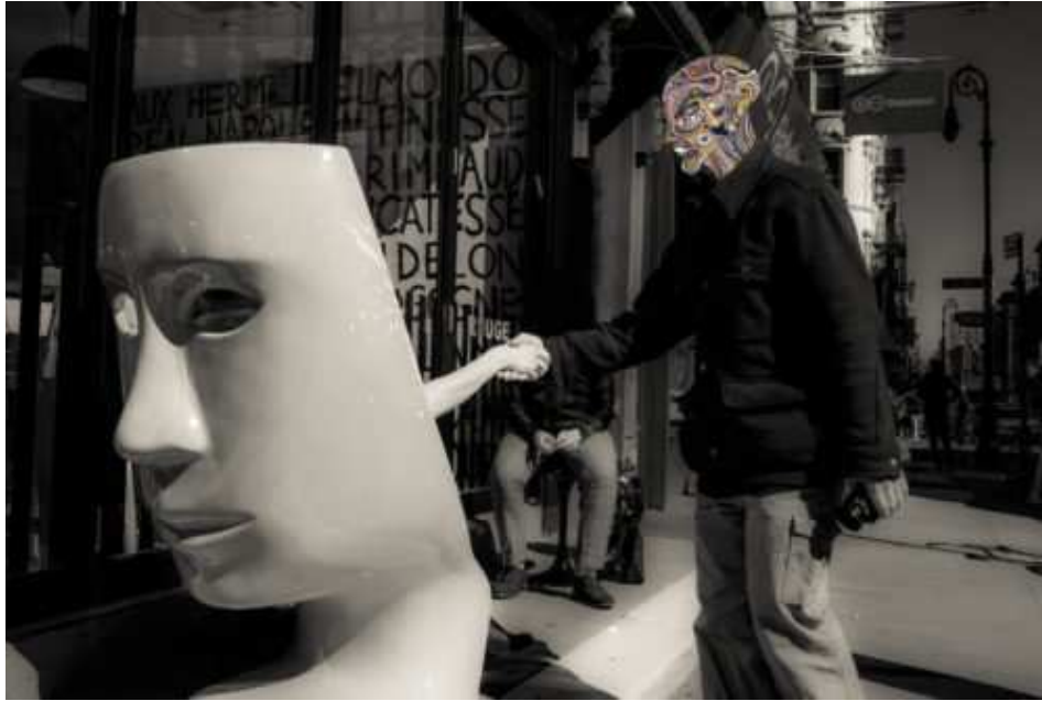
The Time he met