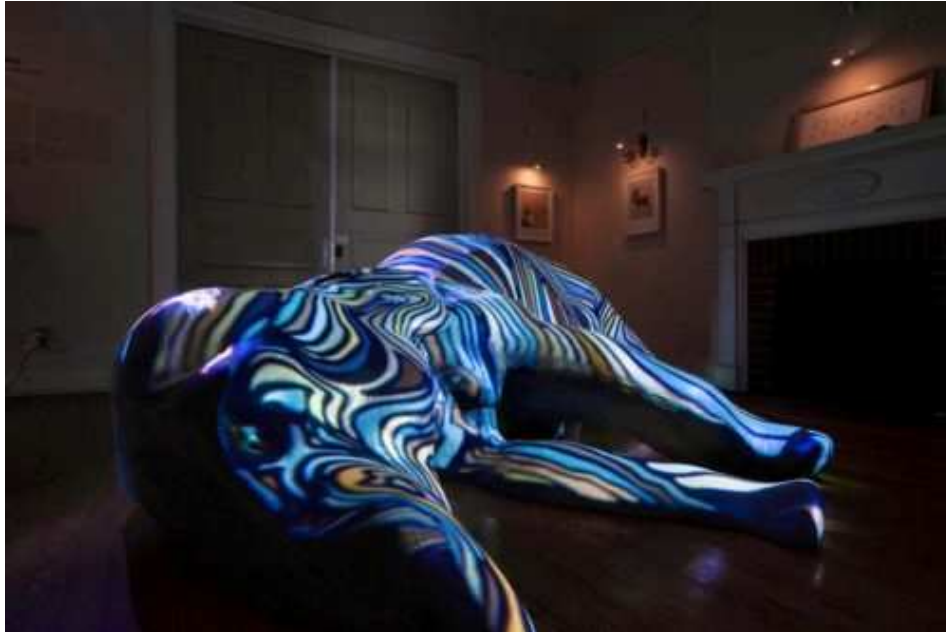
The Animal Is

le flanc d'environ 2 mètres de long. La pièce a été dessinée par l'artiste à l'aide d'un logiciel informatique puis découpée par un traceur, permettant d'obtenir une précision extrême, encore renforcée par un polissage final. L'artiste l'a ensuite peinte d'une couleur grise uniforme. Il a alors repris le travail informatique pour créer des projections de bandes de couleurs s'adaptant parfaitement à la surface de l'animal et évoluant de manière quasiment imperceptible.